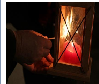
Friedenslicht aus Bethlehem

Herr, mach mich zu einem Werkzeug deines Friedens, dass ich liebe, wo man hasst, dass ich verzeihe, wo man beleidigt, dass ich verbinde, wo Streit ist, dass ich die Wahrheit sage, wo Irrtum droht, dass ich Hoffnung wecke, wo Verzweiflung droht, dass ich Licht entzünde, wo Finsternis regiert, dass ich Freude bringe, wo der Kummer wohnt.