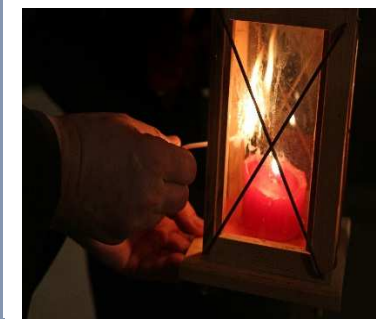
Friedenslicht aus Bethlehem

Herr, mach mich zu einem Werkzeug deines Friedens, dass ich liebe, wo man hasst, dass ich verzeihe, wo man beleidigt, dass ich verbinde, wo Streit ist, dass ich die Wahrheit sage, wo Irrtum droht, dass ich Hoffnung wecke, wo Verzweiflung droht, dass ich Licht entzünde, wo Finsternis regiert, dass ich Freude bringe, wo Kummer wohnt.